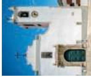
Église paroissiale de Santa Catarina da Fonte do Bispo

Centre d'exposition de la Coopérative de Santa Catarina da Fonte do Bispo (page de droite)