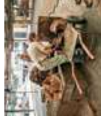
Fabricant de tuiles