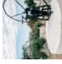
Puits public de 1875

En arrivant au croisement 4 estradas/ routes, prenez la direction de São Brás de Alportel. Le long du chemin, sur la droite (Vale da Assêca), vous pourrez voir quelques tuileries. Cette zone riche en sols calcaires et argileux a favorisé le développement de l'artisanat et de l'industrie céramique. Divers matériaux utilisés dans la construction algarvienne (méditerranéenne) y sont fabriqués: la tuile mauresque, le carrelage,