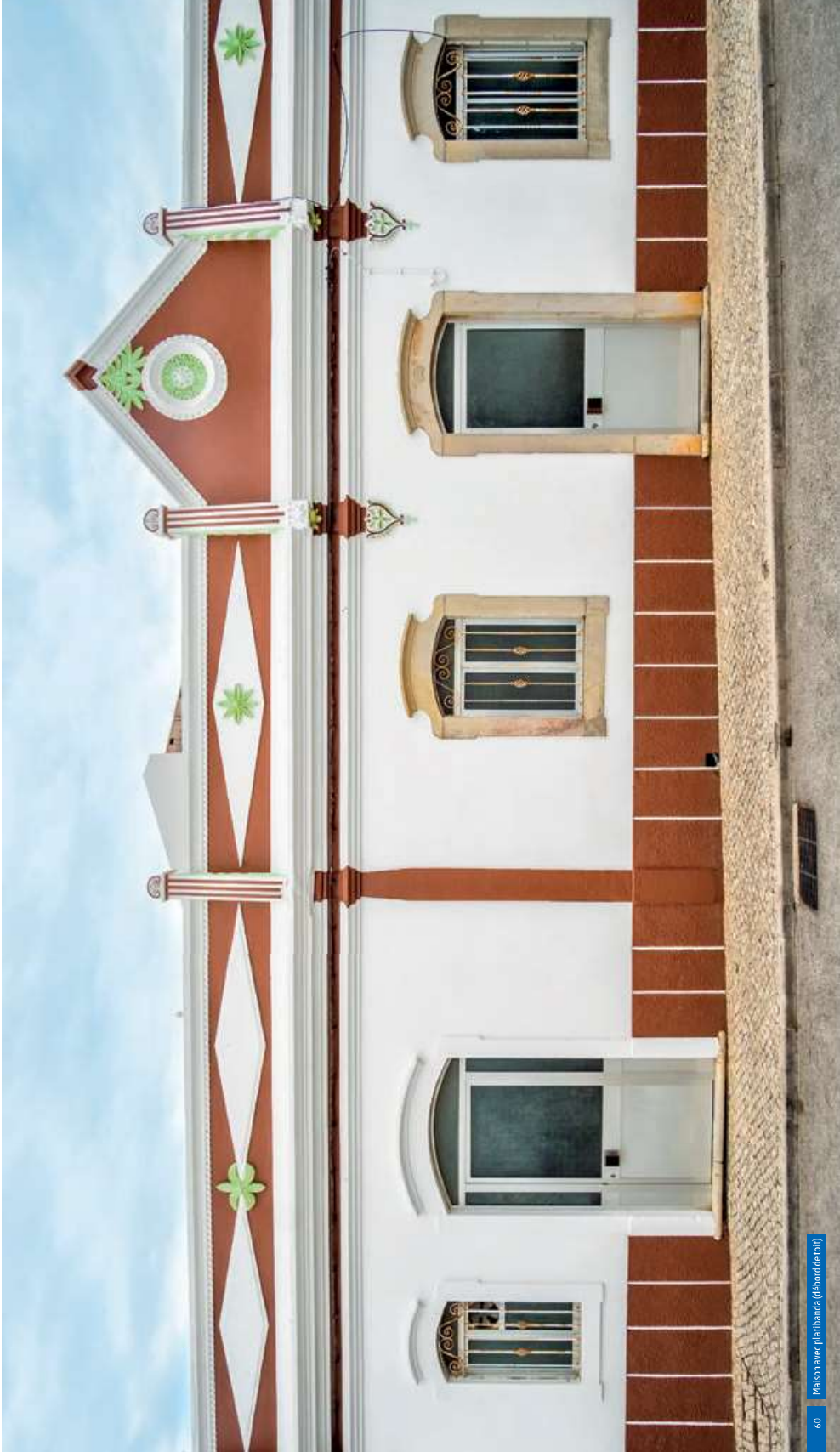
60 Maison avec platibandas (débord de toit)