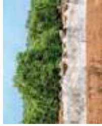
Huerto de naranjos

Si siente curiosidad por conocer alguno de estos montes, haga un desvío, pero regrese después por el mismo camino, en dirección a 7 Alcaria do Cume , el punto más elevado de Tavira, con 535 metros. Aquí podrá aprovechar para disfrutar del paisaje y descansar. Regrese de nuevo por la misma carretera hasta Santa Catarina da Fonte do Bispo, o continúe unos 400 metros. Allí, gire a la derecha y descienda por un camino de tierra batida que pasa por Carvalhal, Malhada do Rico, Eira do Lobo y 8 Umbria , en donde existe un merendero, y continúe por la izquierda en dirección a Morenos. Antes de regresar a la N270 en dirección a Tavira, puede optar por alguna de estas posibilidades: girar a unos 1.400 metros