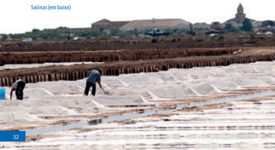
Salinas (em baixo)