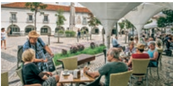
Praça da República

Regresse ao ponto de partida na Praça da República ou aproveite para descansar numa das esplanadas existentes ao longo da Rua José Pires Padinha ou no Mercado da Ribeira.