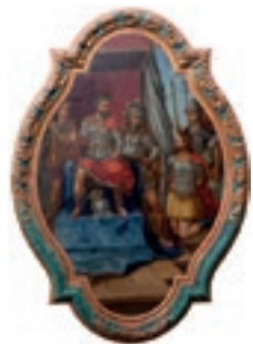
Pintura da Ermida de São Sebastião

Este edifício, fundado por D. Manuel I, em 1509, possui um pórtico lateral da época e sofreu várias alterações e funções ao longo dos tempos. Em 2012 foi alvo de reabilitação e adaptado a habitação sob projeto do arquiteto Souto Moura. Se olhar na direção do oceano vê as salinas integradas no Parque Natural da Ria Formosa