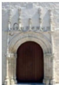
Portal gótico-manuelino, do antigo Mosteiro de N.ª Sr.ª da Piedade