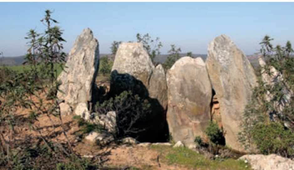
Anta de Masmorra

De regresso ao centro de Cachopo, procure o desvio para o Monte da Mealha, sob indicação de Vale João Farto. Aqui é possível contemplar 8 Casas Circulares , vulgarmente conhecidas por palheiros. Estas edificações, em pedra e telhados de colmo ou palha de centeio, de origem pré-histórica, servem para armazenamento de alimentos para animais. Junto a Mealha, situa-se uma necrópole, a 9 Anta das Pedras Altas , monumento funerário do neolítico, e, em Alcaria Pedro Guerreiro, a 10 Anta de Masmorra .