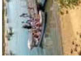
Muelle de embarque