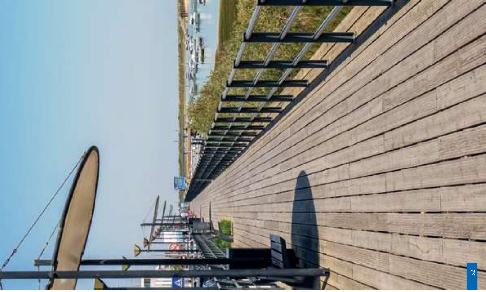
Fortaleza de São João de Barra (abajo)