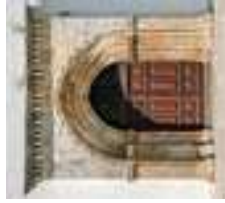
Portada de la iglesia de Nossa Senhora da Conceição

El parque tiene una extensión de 40 hectáreas con diferentes especies de árboles y fauna cinegética, cuatro pequeños embalses, un parque infantil, baños, un merendero y cuatro senderos debidamente señalizados.