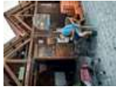
Pescador reparando artes de pesca

Este templo se amplió en junio de 2008. El diseño arquitectónico de la rehabilitación y ampliación de este edificio se inspira en la imagen de un barco, en clara referencia a la actividad pesquera del pueblo.