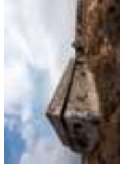
Forte do Rato