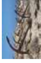
Cementerio de anclas de la playa de Barril

Si lo desea, puede tomar un barco en Santa Luzia para visitar la 7 playa de Terra Estreita , un extenso arenal situado en pleno Parque Natural de Ria Formosa, justo frente al pueblo. De vuelta, en el coche, siga por la costa en dirección a Pedras D'El Rei para conocer la 8 playa de Barril , a la cual se puede acceder a pie o en un pequeño tren del complejo turístico. Observe el imponente cementerio de anclas y los restos de las antiguas instalaciones de la pesca del atún – de 1842 –, reconvertidas ahora en una zona comercial. Antes de continuar hacia Luz de Tavira, pase frente a la recepción de la urbanización Pedras D'El Rei y gire en la segunda calle a la izquierda (Rua Jorge Amado). A unos 25 metros más adelante, encontrará a su izquierda un 9 olivo de 2.000 años , considerado de interés público desde 1984. Su copa alcanza una altura de 7,70 metros, y tiene un diámetro superior a los 11,80 metros. Después de esta visita, gire a la izquierda por el CM 1347 y continúe unos 800 metros. Al llegar a la E.R. 125, gire a la izquierda en dirección a Faro. El pueblo de Luz de Tavira se encuentra a casi un kilómetro. En el centro de este pueblo podrá contemplar las casas típicas con platabandas de argamasa y chimeneas muy pronunciadas y decoradas. A la salida, en Largo da República, visite la 10 iglesia principal de Nossa Senhora da Luz . En su