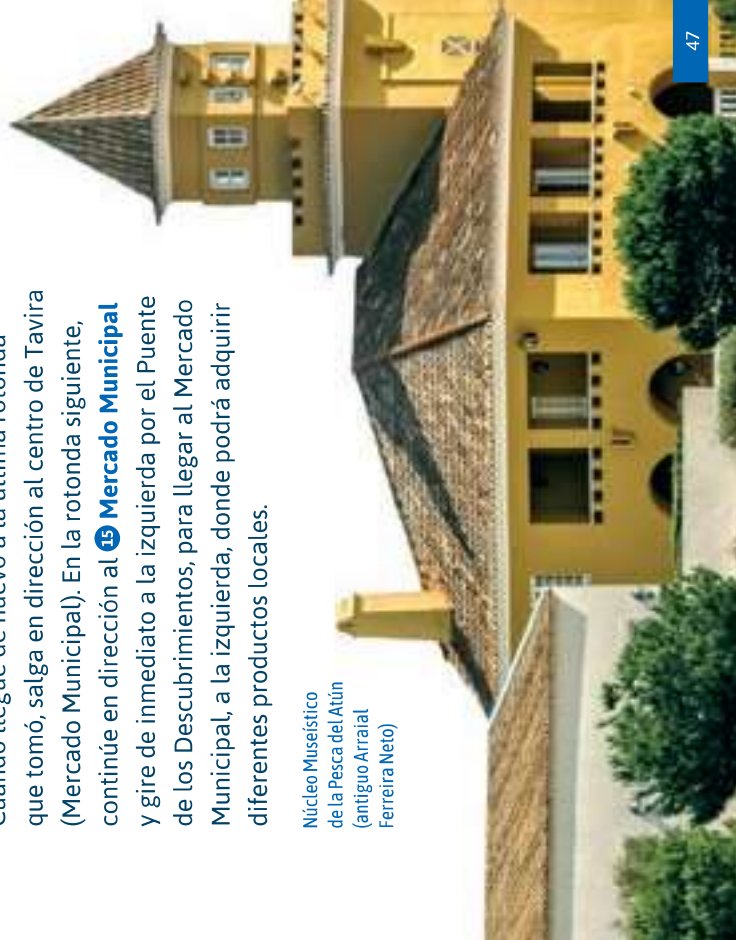
Núcleo Museístico de la Pesca del Atún (antiguo Arraial Ferreira Neto)