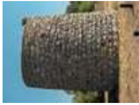
Torre de Aires

interior encontrará una típica iglesia de salón del siglo XVI con tres naves a la misma altura. En la capilla mayor destaca un retablo manierista del siglo XVII. El exterior presenta una fachada manierista y una portada lateral manuelina con intercolumnios y capiteles labrados con vides y racimos de uvas.