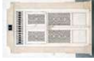
Puerta de reja

A continuación, gire a la derecha hasta el Largo das Portas do Postigo, donde, en la Rua das Olarias, podrá observar una 11 puerta de reja . Si continúa por esa calle, al final, en el lado izquierdo, encontrará el 12 Antiguo Hospital Militar (actual comedor militar), que fue construido a finales del siglo XVIII. Regrese hasta el parador, baje por Rua D. Paio Peres Correia y contemple, a su izquierda, la 13 iglesia de Santiago , posiblemente edificada a inicios del siglo XIII en el lugar de la antigua mezquita menor. Este templo, reconstruido tras el terremoto de 1755, posee en su interior obras de talla, pintura e imágenes de arte sacro.