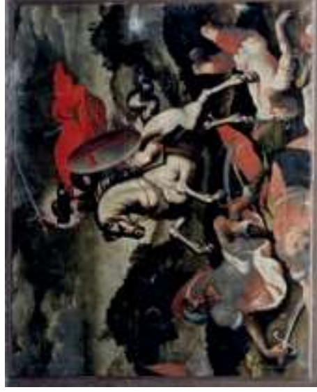
Santiago luchando a caballo contra los moros (pintura de la iglesia de Santiago)

Al final de la Rua D. Paio Peres Correia llegará a una de las principales arterias de la ciudad: la Rua da Liberdade. A su izquierda, se erige el edificio de Correos y, enfrente, la 14 capilla de Nossa Senhora da Consolação , cuyo origen se remonta a 1648, momento en que se creó la cofradía de Nossa Senhora da Consolação dos Presos. Esta cofradía tenía un objetivo específico: dar apoyo moral y espiritual a los reclusos de la