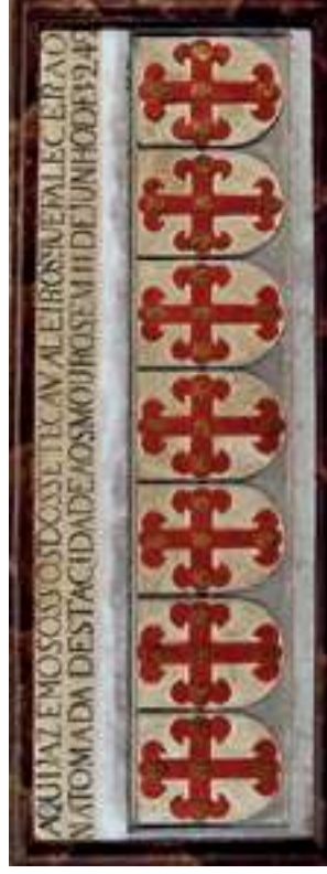
Túmulo de los siete caballeros mártires de la conquista de Tavira

Saliendo del castillo, encontrará la iglesia de Santa Maria do Castelo , que fue edificada en el siglo XIII sobre la antigua mezquita mayor musulmana, tras la reconquista de Tavira a los moros por la Orden de Santiago. Esta iglesia fue reconstruida tras el terremoto de 1755 por el arquitecto italiano Francesco Fabri. Antes de entrar en el templo, observe las estaciones de la Vía Sacra, labradas en piedra e inscritas en las paredes exteriores. Admire el pórtico gótico de la fachada principal. En la capilla mayor podrá observar, en la parte derecha, el túmulo de los siete caballeros derrotados en la toma de la