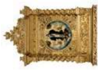
Retablo lateral de la iglesia de Misericórdia

Después de esta visita, suba el empedrado en dirección al Largo Abu Otmane, donde es posible observar la torre del reloj de la iglesia de Santa Maria do Castelo. En esta misma plaza, a la izquierda, se encuentra la entrada del 8 castillo de Tavira , a partir del cual se desarrollaron las murallas de la ciudad. En el interior del castillo